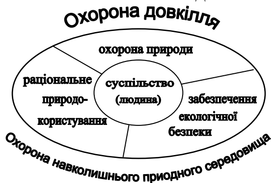
Рис.1. СИСТЕМА ОХОРОНИ ДОВКІЛЛЯ

Таким чином, постала проблема охорони довкілля як життєвого простору людини. Нині охорона навколишнього природного середовища охоплює і охорону природи, і раціональне використання природних ресурсів, і забезпечення екологічної безпеки здоров’я та життя людини (див. рис.1).